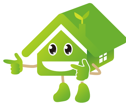
グレード表示の改正