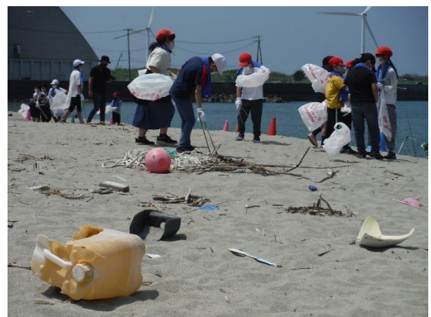
「美しいやまがたの海クリーンアップ運動」の様子