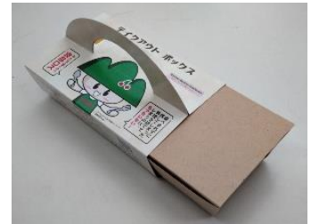
テイクアウトボックス