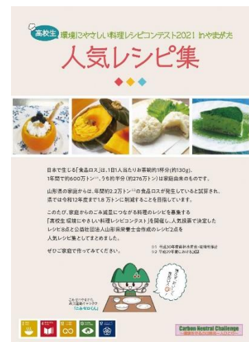
「高校生環境にやさしい料理レシピコンテスト」