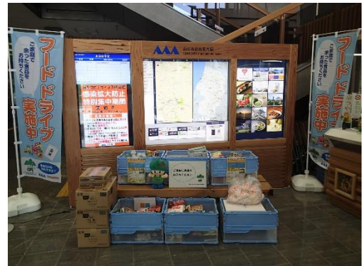
フードドライブの実施