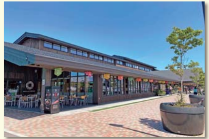
道の駅米沢 (お食事処・お土産・農産物直売所)