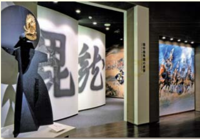
伝国の杜 (米沢市上杉博物館・置賜文化ホール)