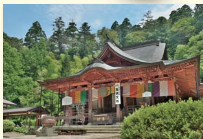
亀岡文珠堂 (学問の神様)