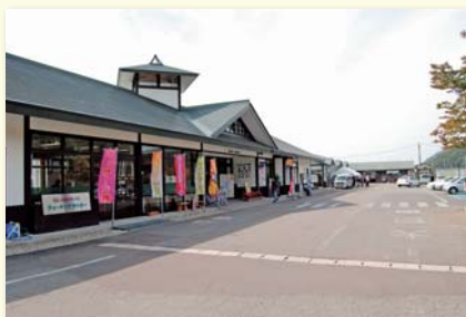
道の駅たかはた (お食事処・お土産・農産物直売所)