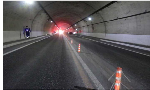
【Aの進行方向から見た現場の状況】