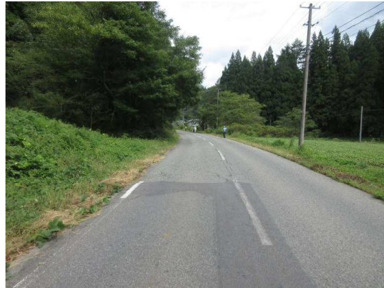
【Aの進行方向から見た現場の状況】