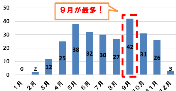
発生月別 自動二輪乗車中死傷者数