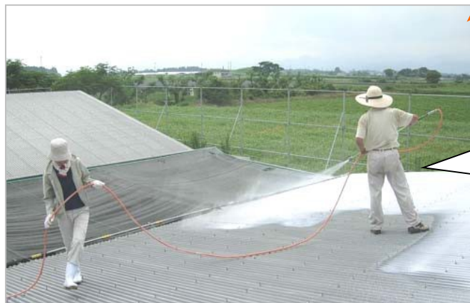
屋根への石灰の吹き付け（宮崎県）