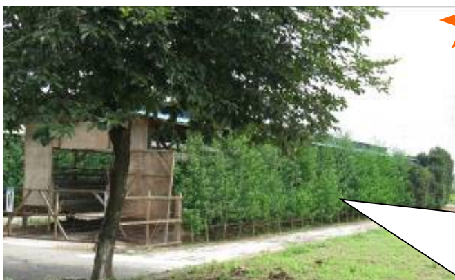
アカザを利用した鶏舎（群馬県）