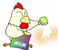
家きん舎周囲への 消石灰散布