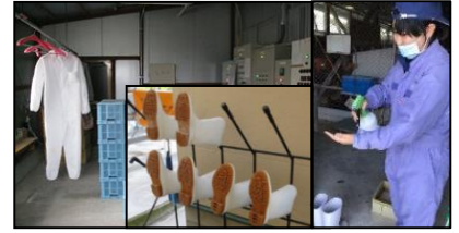
専用の服や靴の使用、手指消毒