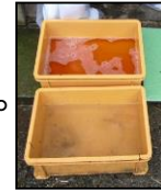
推奨される踏込消毒槽の設置方法！