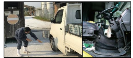
車両はタイヤだけでなく、 泥よけの内側まで消毒 し、 フロアマットの交換 や ペダル等車内も消毒