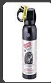
クマ撃退スプレー

④ 万一、クマに出合ったら、背を向けずに、ゆっくり後退してください。(クマ撃退スプレーの使用も有効です。)