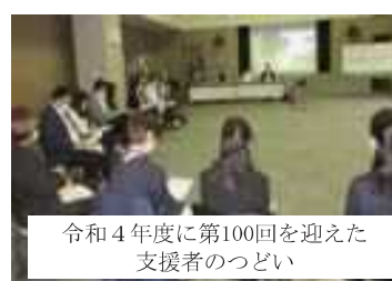
令和4年度に第100回を迎えた支援者のつどい