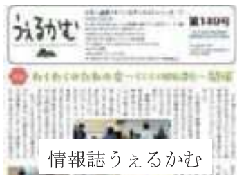
情報誌うしろかぜ