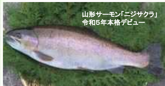
山形サーモン「ニジサクラ」 令和5年本格デビュー