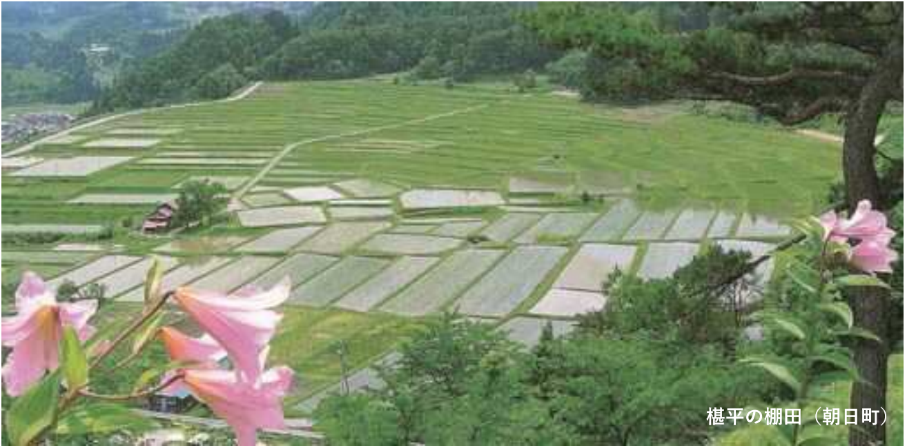
榎平の棚田（朝日町）