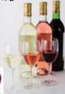
山形県のワイナリー 19場

おいしい農林水産物がいっぱいの山形県 山形県産農林水産物・県産品を 食べて飲んで元気になろう！