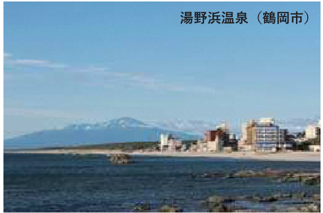
湯野浜温泉（鶴岡市）