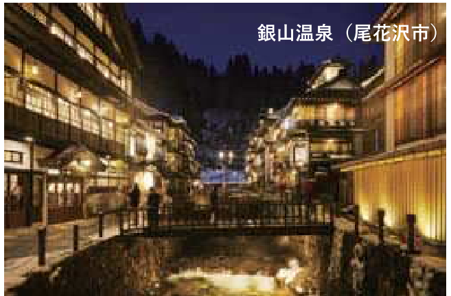
銀山温泉（尾花沢市）