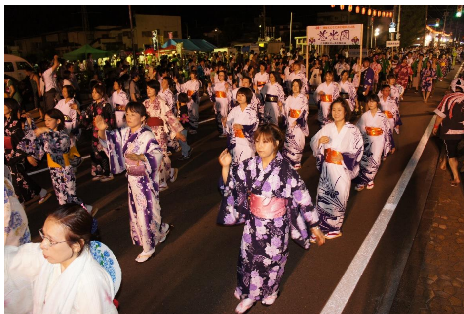
長井おどり大パレード(長井市)