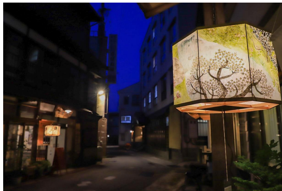
肘折温泉街(大蔵村)