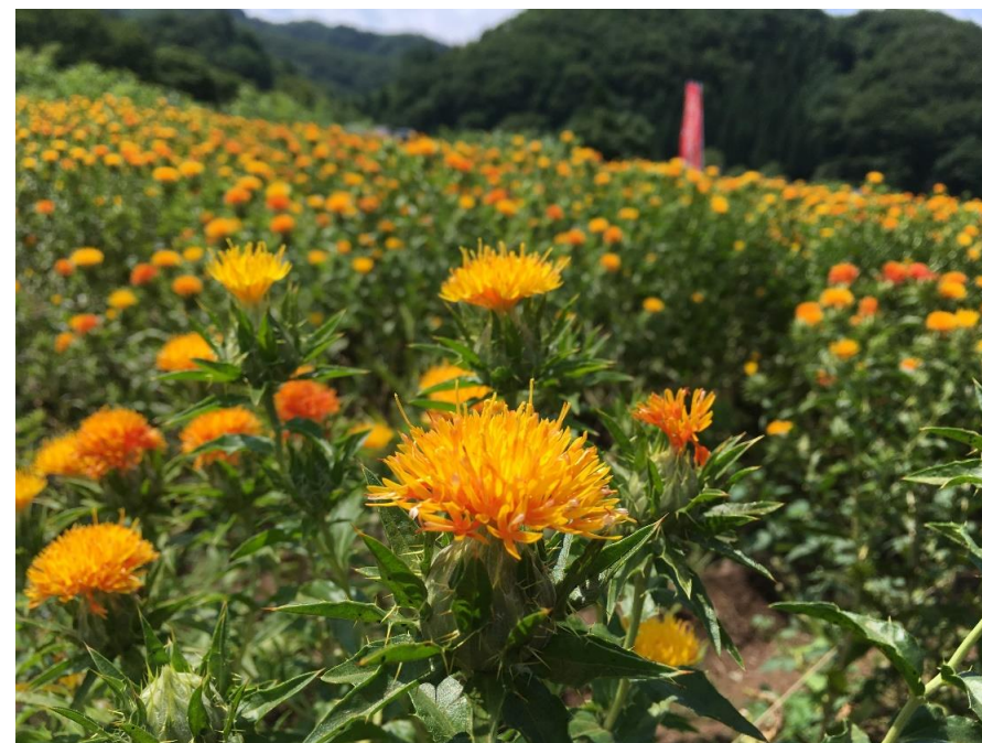
おくのほそ道天童紅花まつり(天童市)