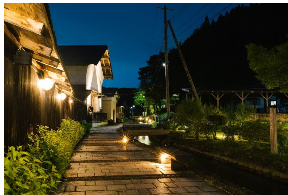
大堰ライトアップ(金山町)