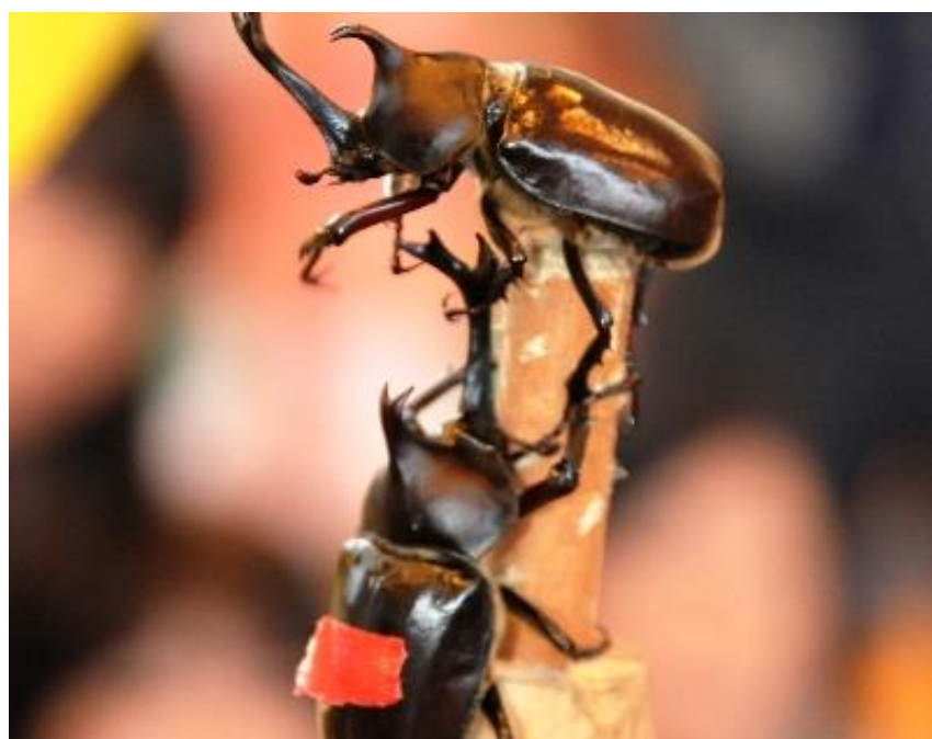
全国かぶと虫相撲大会(中山町)