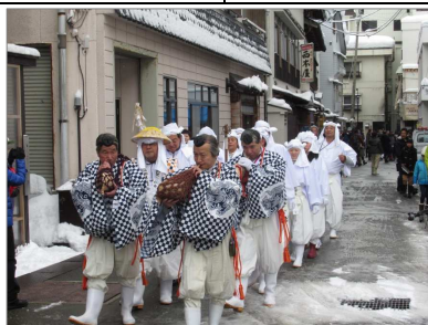
肘折さんげさんげ(大蔵村)