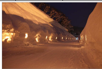
肘折幻想雪回廊(大蔵村)