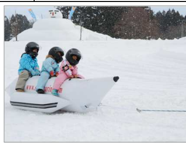
どんでん平スノーパーク(飯豊町)