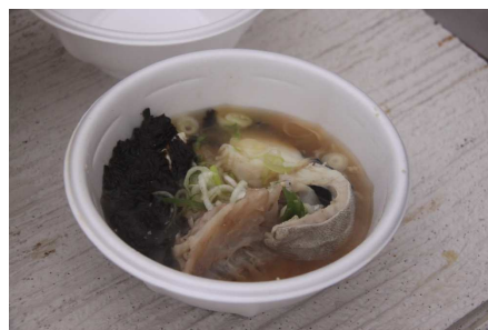
ゆざ町鱈ふくまつり(遊佐町)