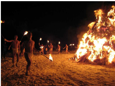
赤倉温泉お柴灯まつり(最上町)