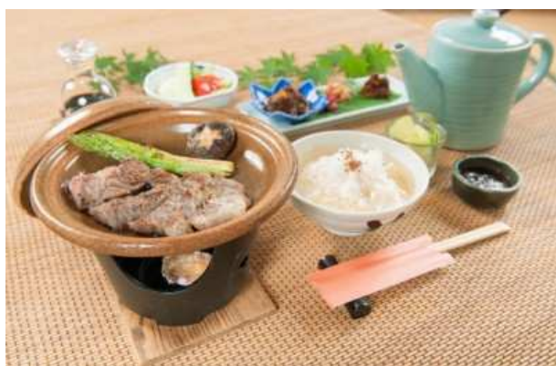
最上町 水かけまんまフェア