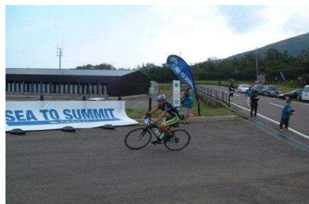
遊佐町 鳥海SEA TO SUMMIT2016