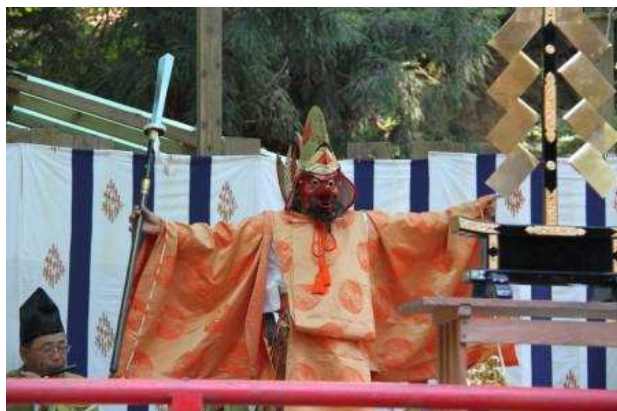
東根市 若宮八幡宮風祭り