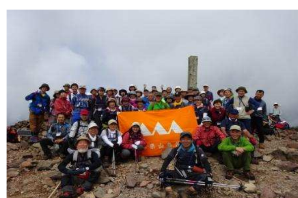
東根市 御所山市民登山