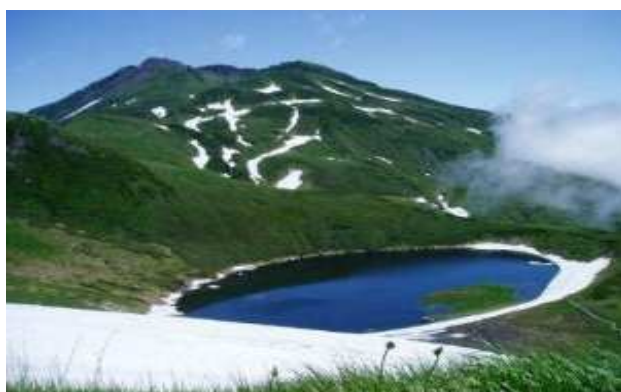
遊佐町 鳥海山登山ツアーV