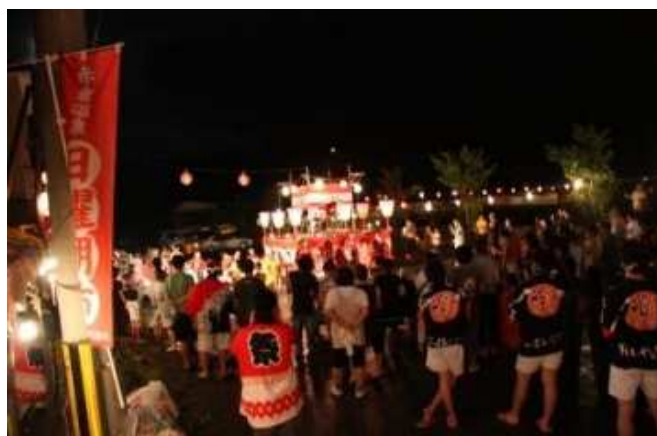
最上町 赤倉温泉 夏祭り