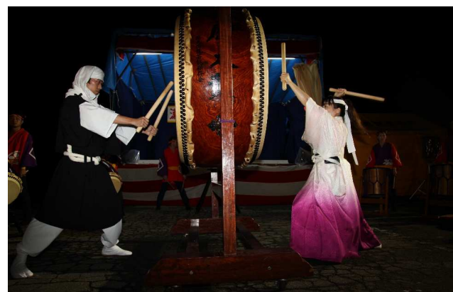
最上町 瀬見まつり