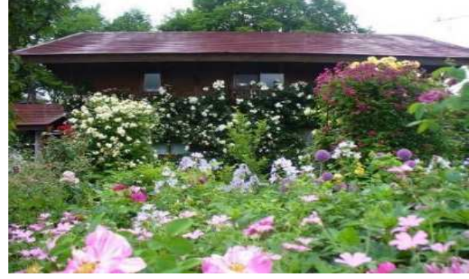
上山市 蔵王ペンション村オープンガーデン