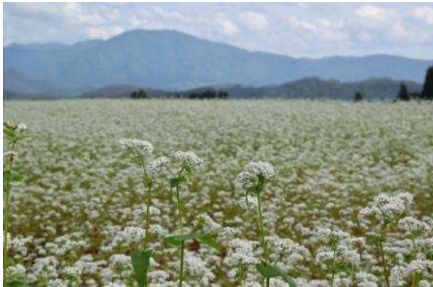
村山市 そば花まつり