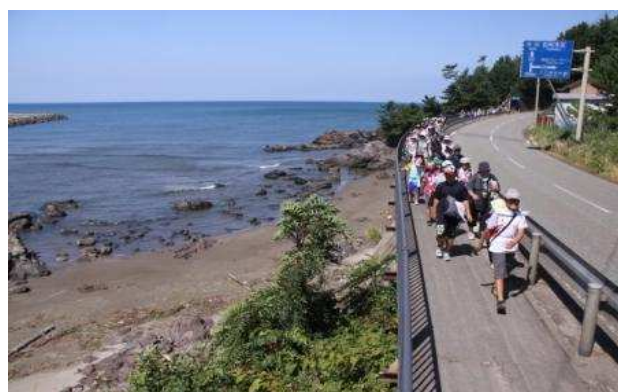
遊佐町 奥の細道鳥海ツアーデーマーチ