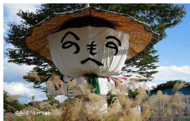
上山市 かみのやま温泉全国かかし祭