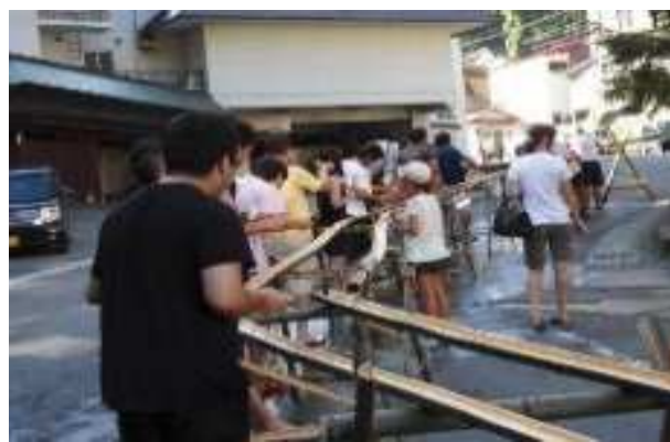
最上町 日曜朝イチ流しそうめん