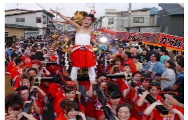
大石田町 御輿の競演