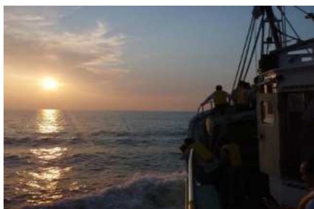
鶴岡市 鼠ヶ関漁船クルージング