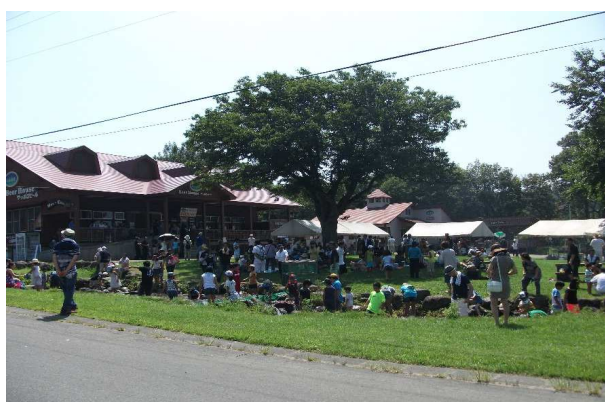
最上町 前森高原サマーフェスティバル