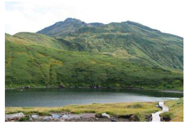
遊佐町 鳥海山登山ツアーⅣ