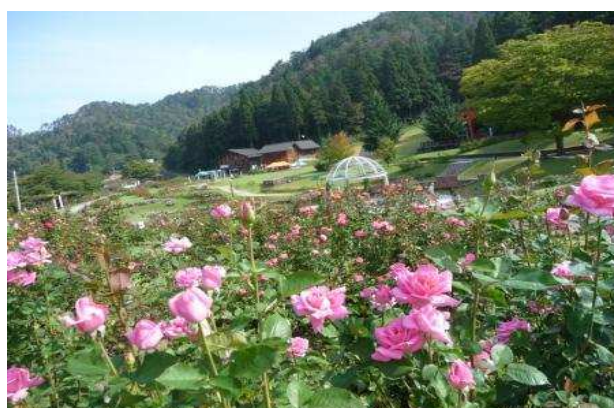
村山市 秋のバラまつり2016