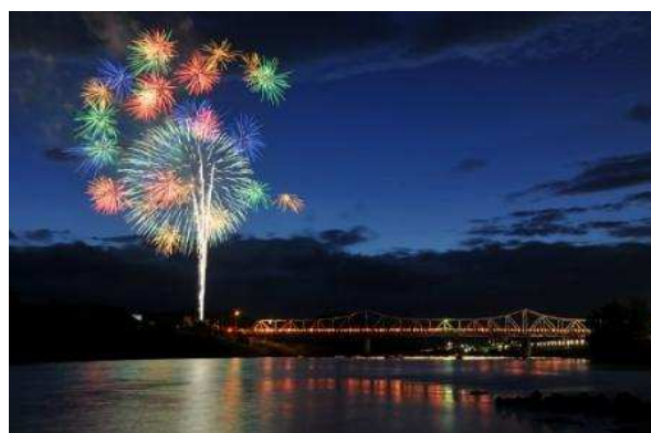
大石田町 最上川花火大会