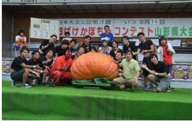
東根市 おばけかぼちゃコンテスト