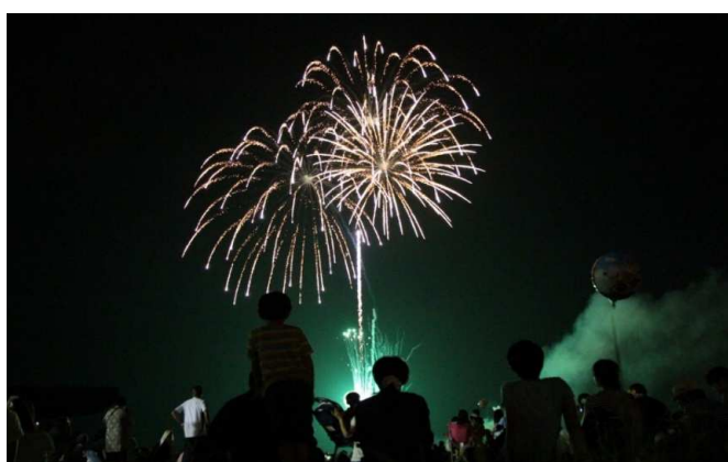
川西町 川西夏まつり