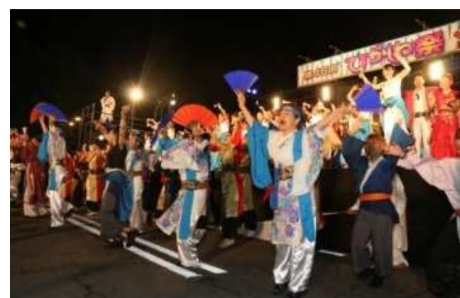
東根市 ひがしね祭