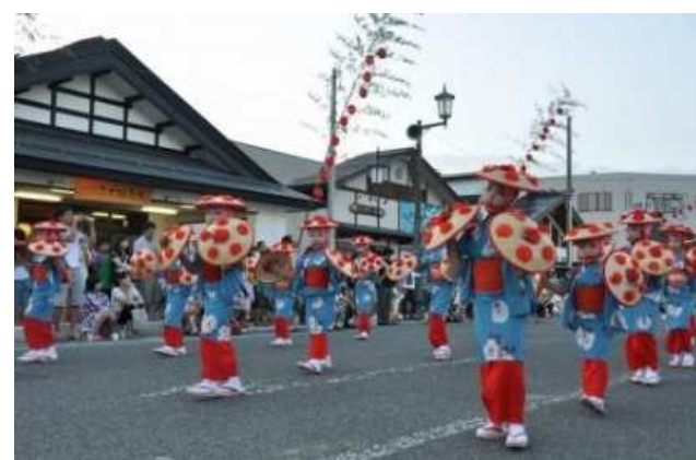
高島町 青竹ちょうちんまつり