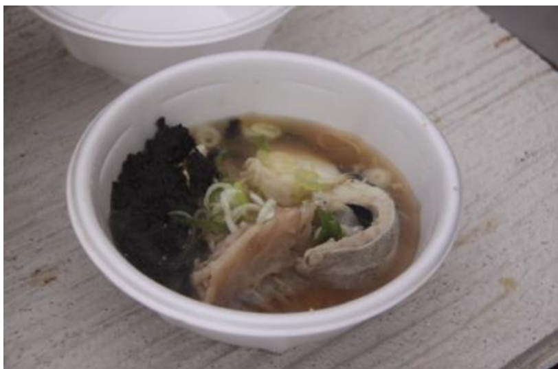
遊佐町 ゆざ町鱈ふくまつり