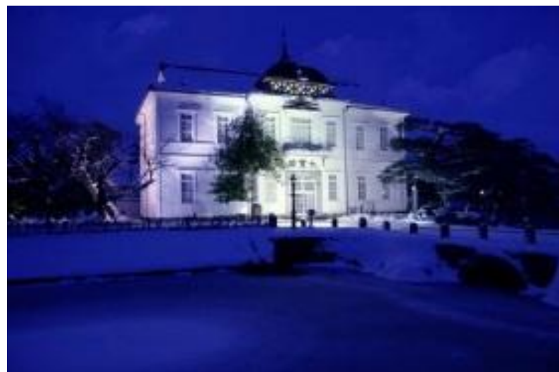
鶴岡市 「雪の降るまちを」鶴岡冬まつり