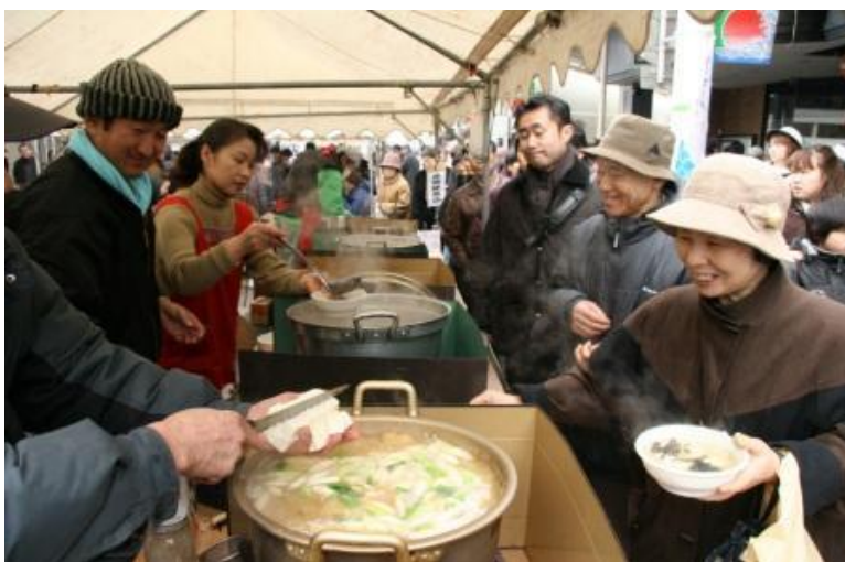
鶴岡市 日本海寒鱈まつり