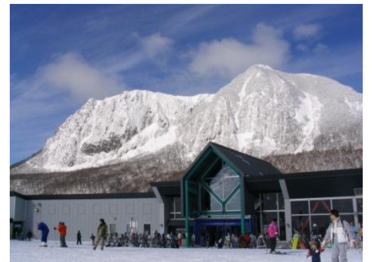
東根市 黒伏高原スノーパーク 「ジャングル・ジャングル」オープン