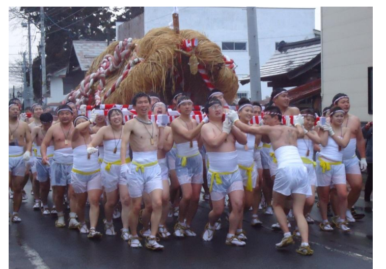
高島町 たかはた冬まつり わらじみこしまつり