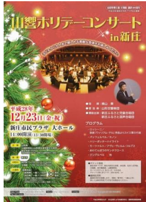
新庄市 市民プラザホ リデーコン サート