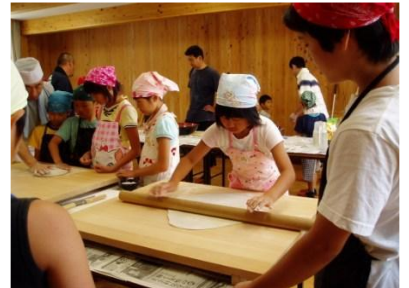
遊佐町 “年越しそば” 打ち体験