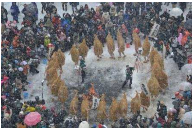
上山市 上山市民俗行事「加勢鳥」