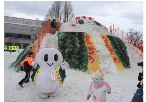
尾花沢市 第42回雪まつり