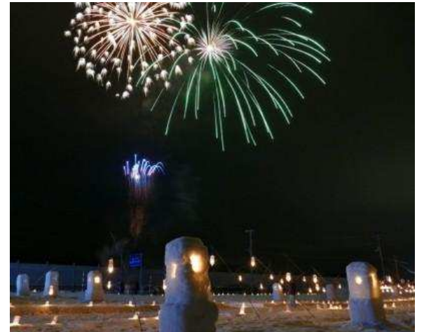
最上町 富沢地域 雪まつり