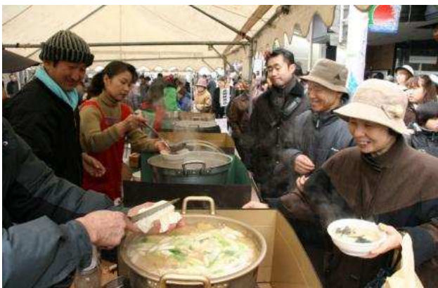
鶴岡市 日本海寒鱈まつり