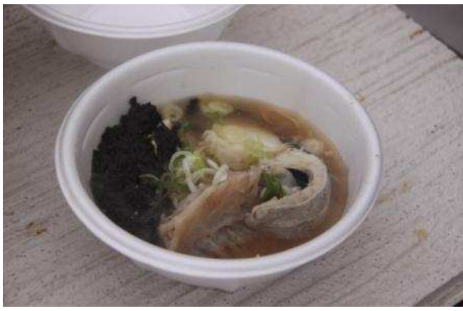
遊佐町 ゆざ町鱈ふくまつり