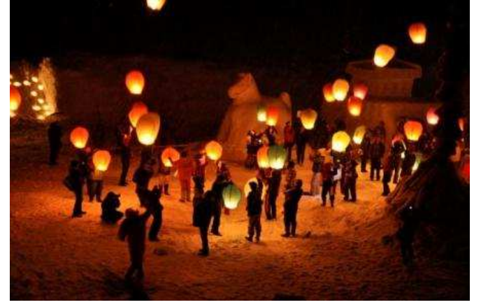
飯豊町 中津川雪まつり