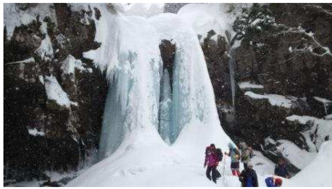
遊佐町 ニノ滝氷柱トレッキング