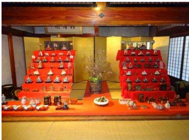
遊佐町 旧青山本邸ひなまつり