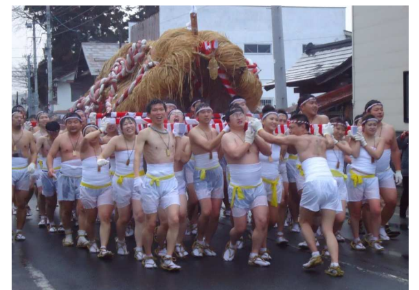
高畠町 たかはた冬まつり わらじみこしまつり