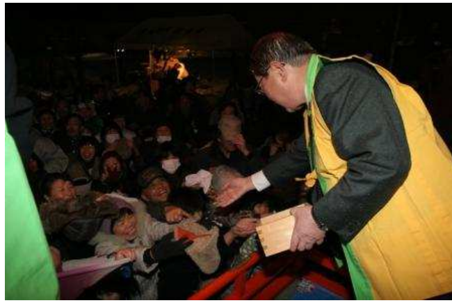
東根市 第41回ひがしね雪まつり