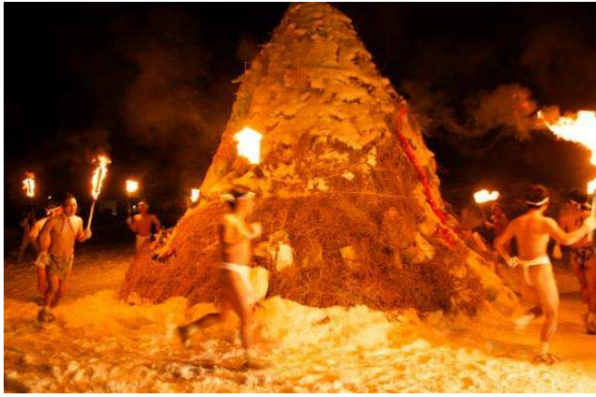
最上町 赤倉温泉 大お柴灯まつり