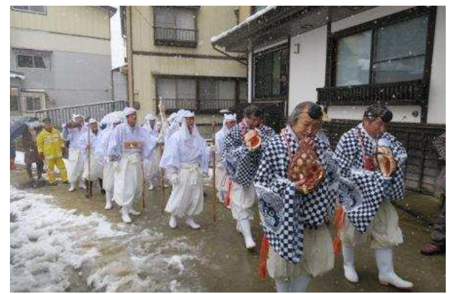
大蔵村 肘折さんげさんげ