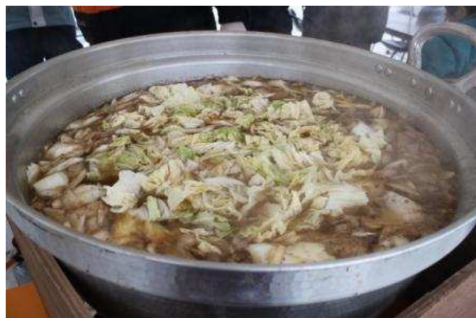
最上町 大堀地区鍋まつり