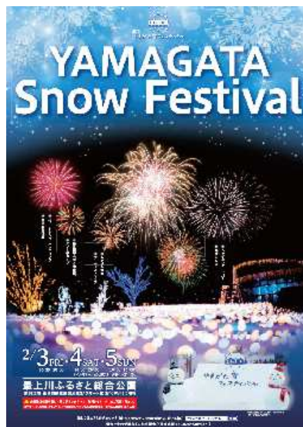
第2回やまがた雪フェスティバル