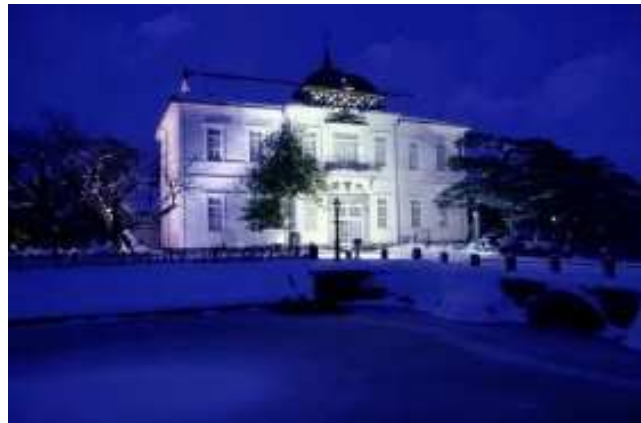
鶴岡市 「雪の降るまちを」鶴岡冬まつり