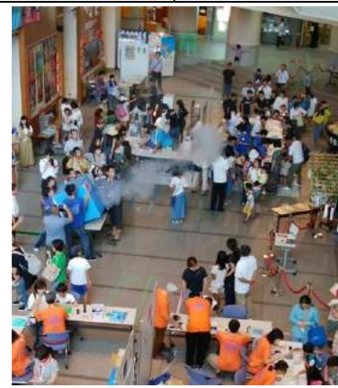
2019青少年のための科学の祭典 in山形(山形市)