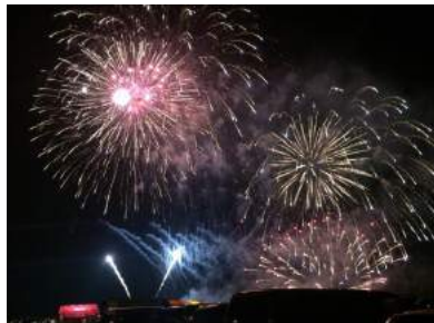
ゆげ町夕日まつり(遊佐町)