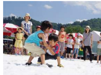
SNOWえっぐフェスティバル(飯豊町)