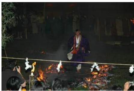
さくらんぼ東根温泉火渡り式(東根市)