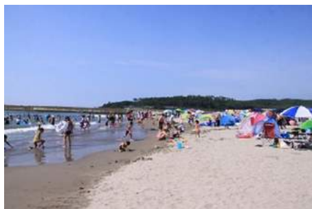
海水浴場開き(遊佐町)