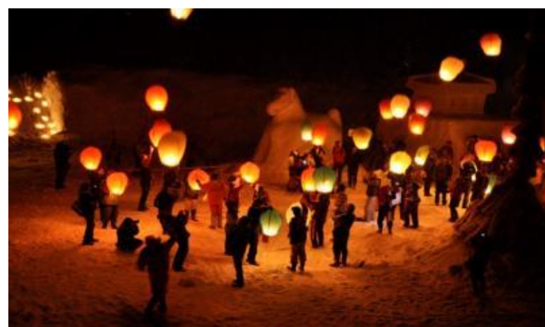
中津川雪まつり(飯豊町)