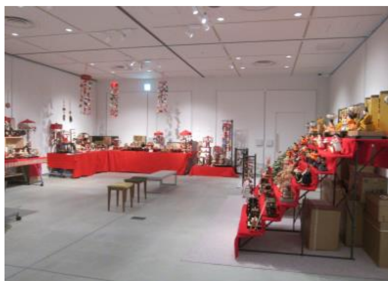
東根のひな飾り(東根市)

※積雪状況により、一部イベントの日程や内容が変更になる場合があります。詳しくはお問い合わせください。