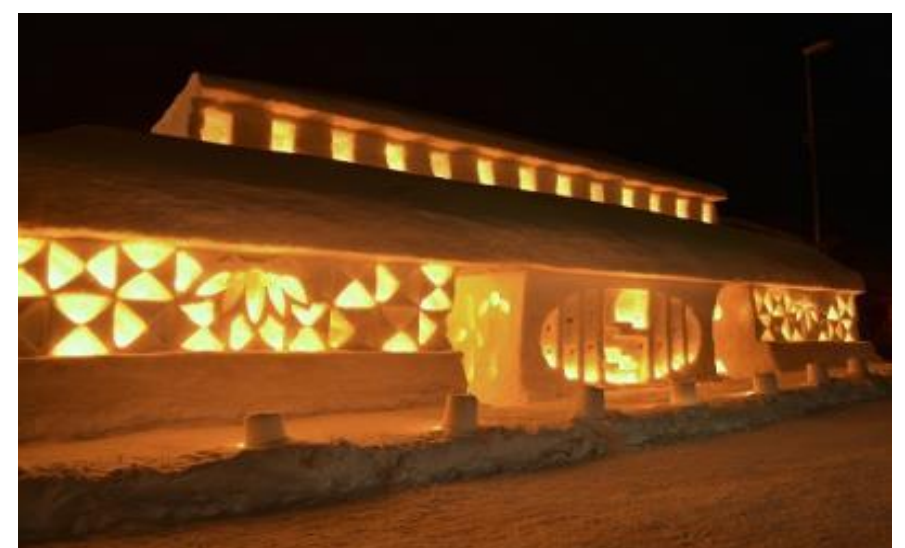
第15回月山志津温泉雪旅籠の灯り(西川町)