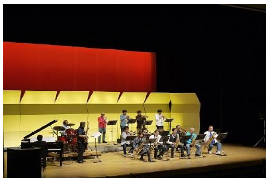
春待ち音楽祭(川西町)

※積雪状況により、一部イベントの日程や内容が変更になる場合があります。詳しくはお問い合わせください。