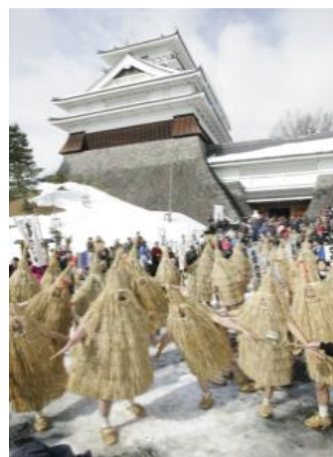
上山市民俗行事 加勢鳥(上山市)