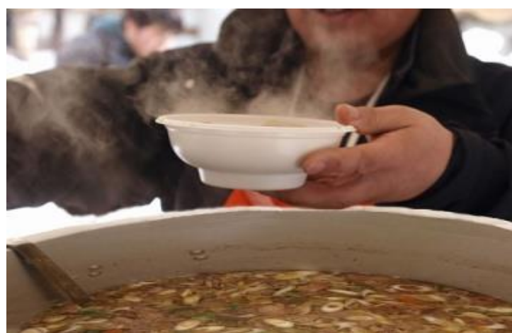
大堀地区鍋まつり(最上町)

※積雪状況により、一部イベントの日程や内容が変更になる場合があります。詳しくはお問い合わせください。