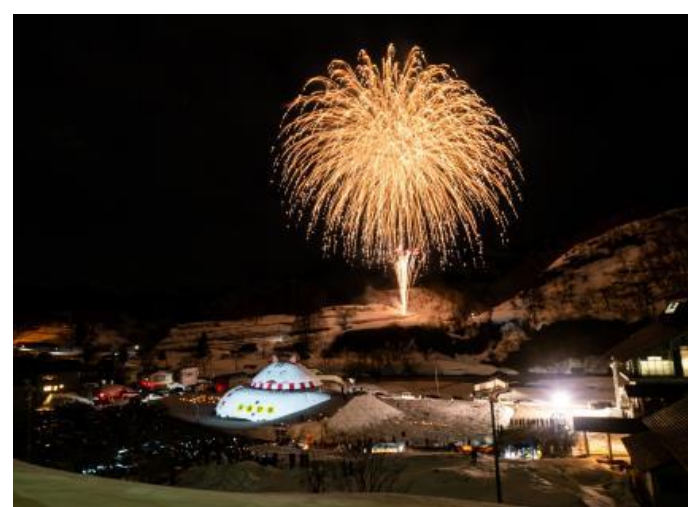
第24回おおくら雪ものがたり(大蔵村)