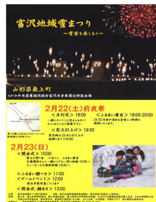
富沢地域 雪まつり(最上町)