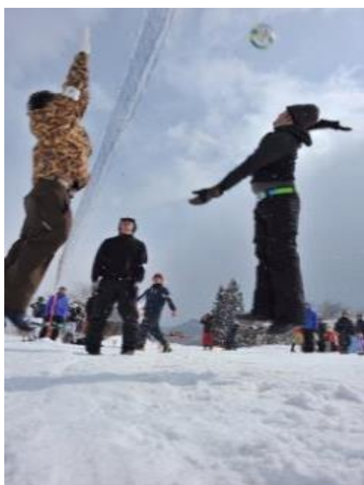
第7回雪上バレーボール大会in西川町

※積雪状況により、一部イベントの日程や内容が変更になる場合があります。詳しくはお問い合わせください。