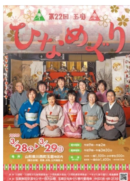
第22回玉庭ひなめぐり(川西町)