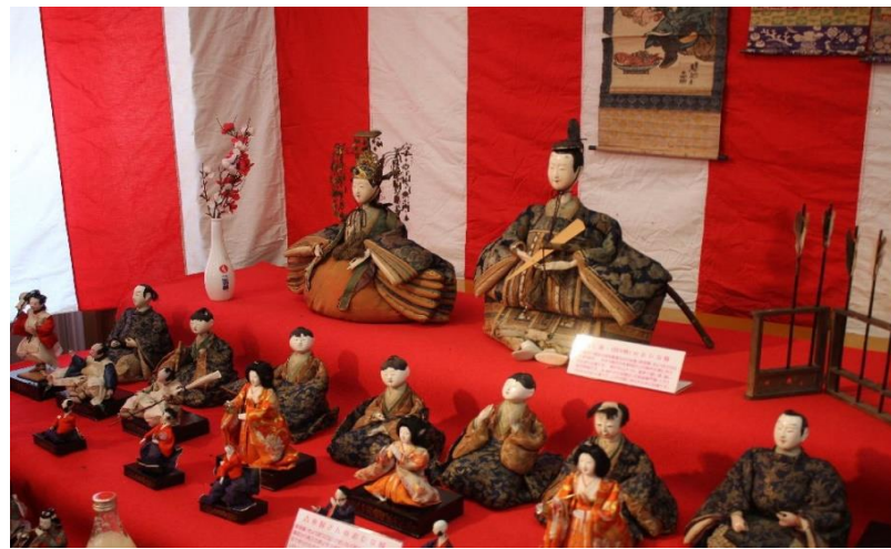
瀬見温泉 春の宴「ひなまつり」(最上町)