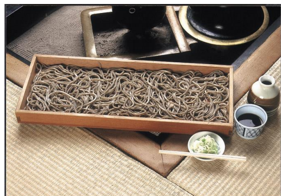
板そばまつり(村山市)