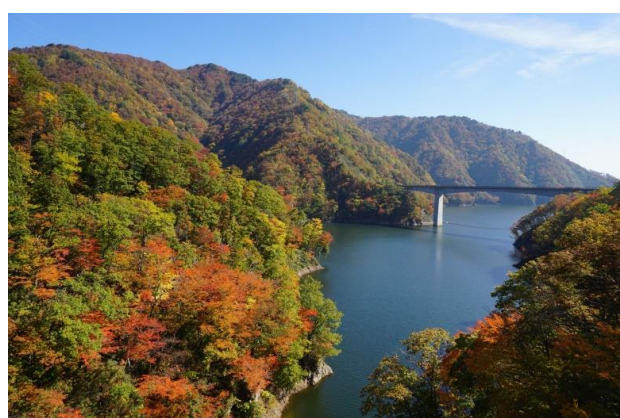
長井百秋湖(長井市)