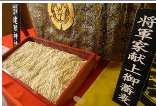
将軍家献上寒中挽き抜きそばのご案内(天童市)