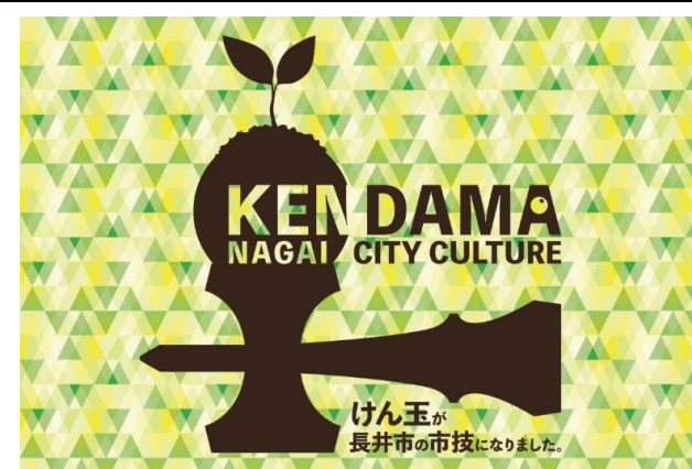
けん玉市技認定記念キャンペーン(長井市)