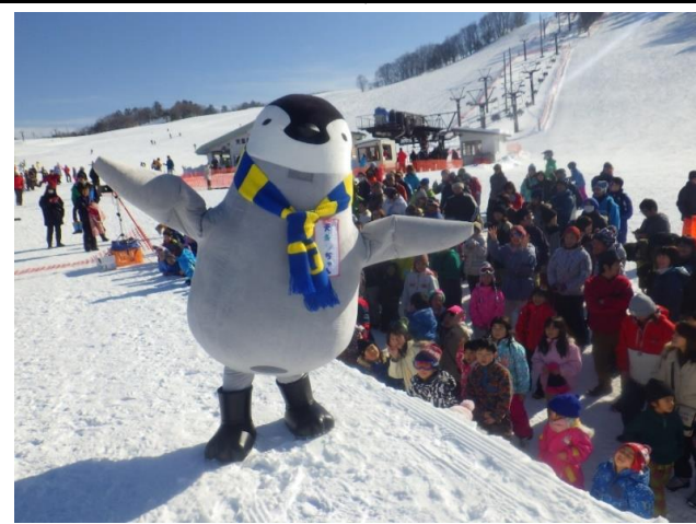
天童高原スキー場開き(天童市)