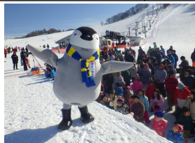
天童高原スキー場(天童市)