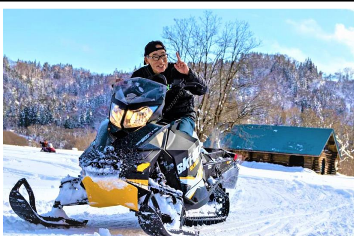
白川荘で雪遊び(飯豊町)