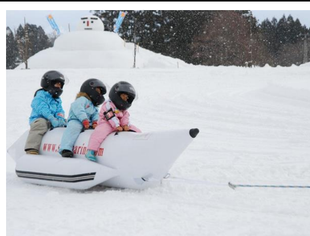
どんでん平スノーパーク(飯豊町)