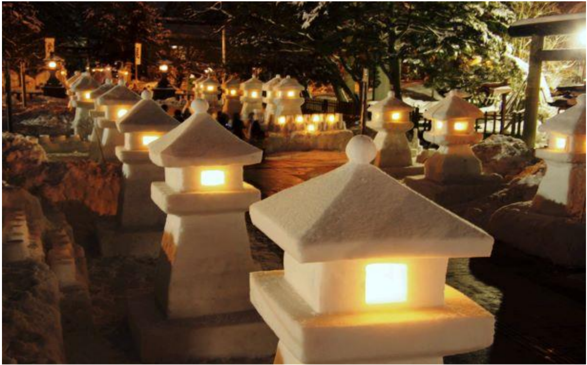
第49回上杉雪灯籠まつり(米沢市)