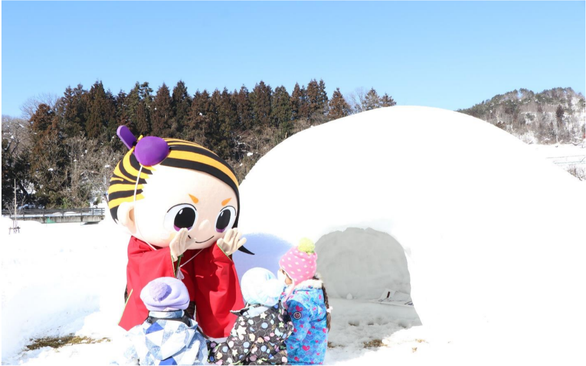
紅花資料館ふゆまつり(河北町)