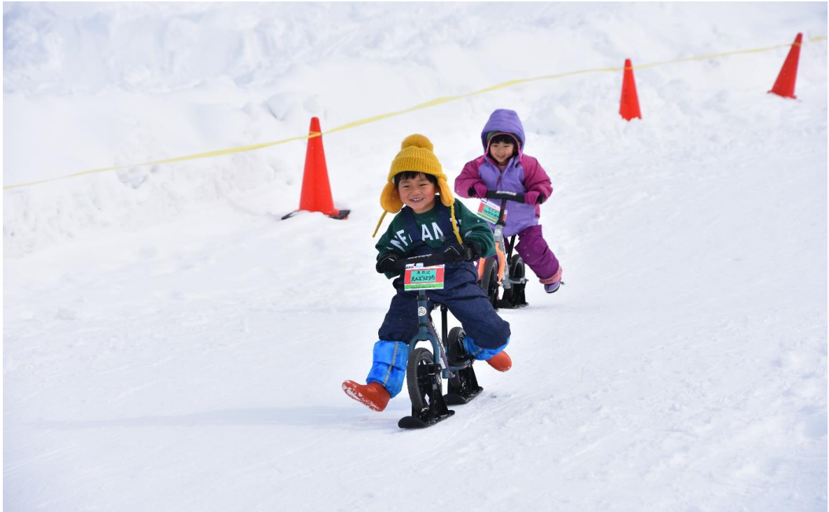
徳良湖スノーランド(尾花沢市)