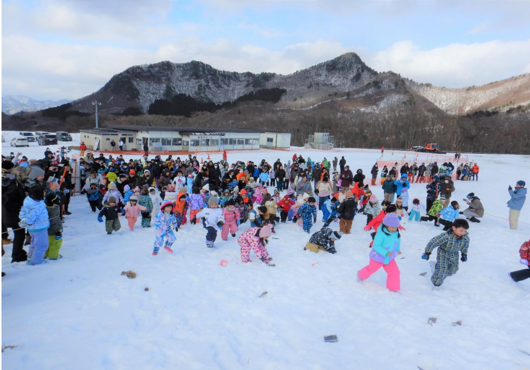
第14回天童高原スノーパークフェスタ(天童市)