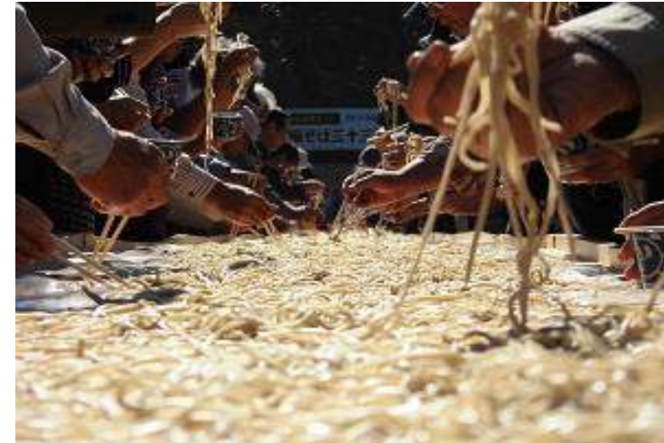
村山市 伝承館まつり