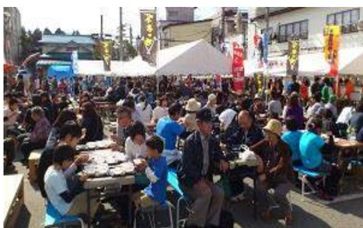
最上町 大産業まつり