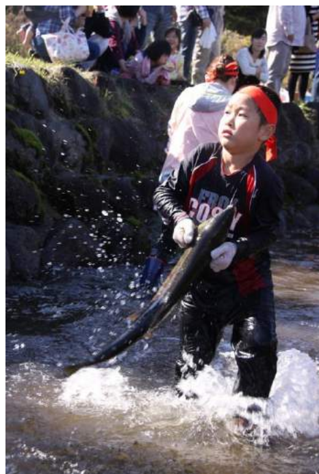
遊佐町 鮎のつかみどり大会