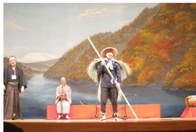
東根市 最上川舟唄全国大会