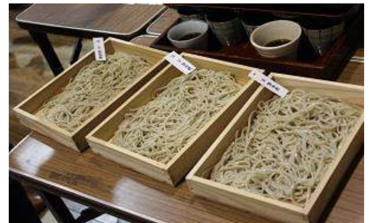
最上町 新そばまつり