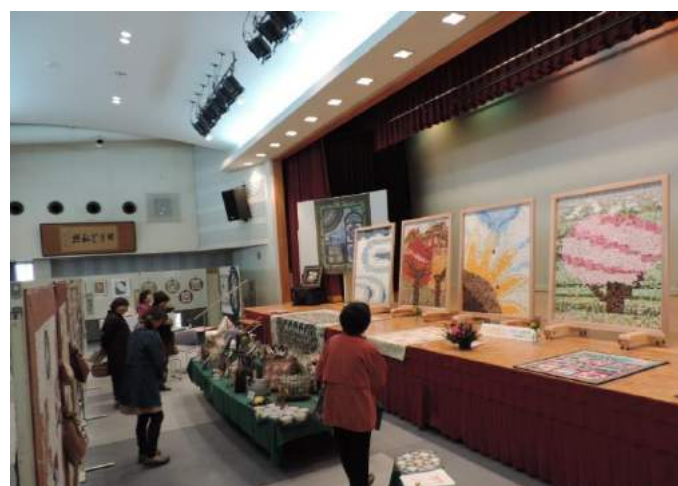
最上町 最上町総合芸術文化祭