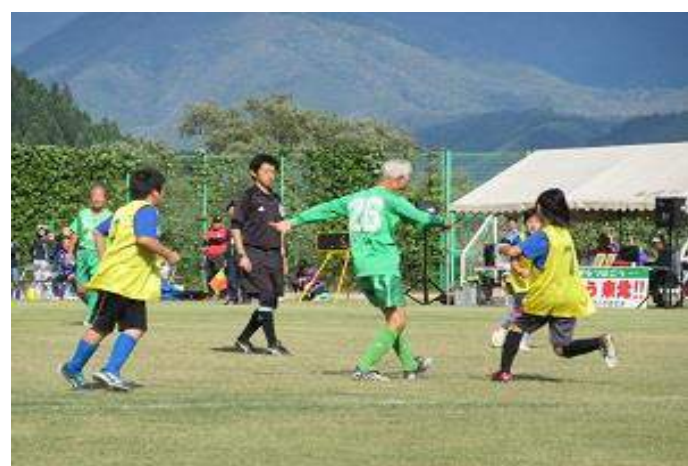
最上町 シニアサッカー