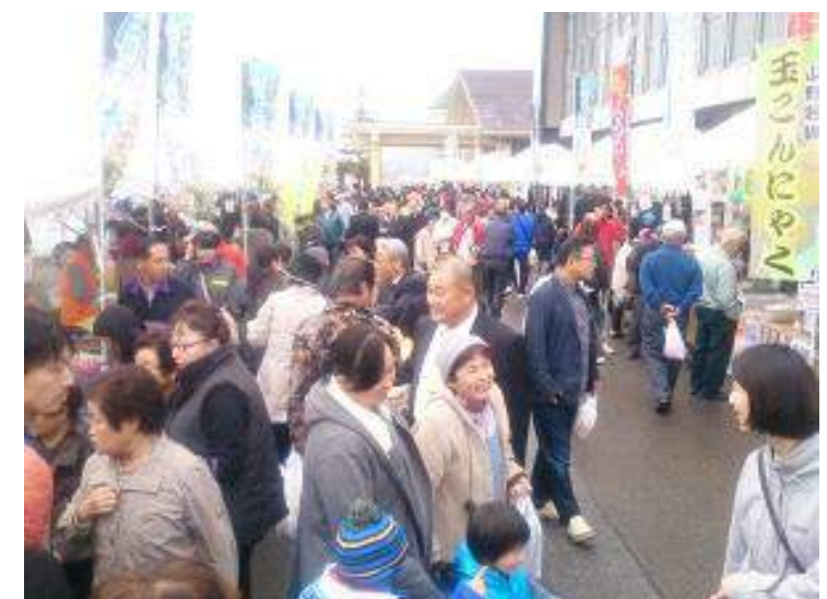
戸沢村 とざわ旬の市