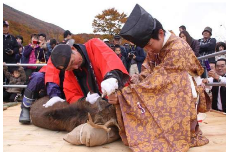
遊佐町 鳥海山神鹿角切祭