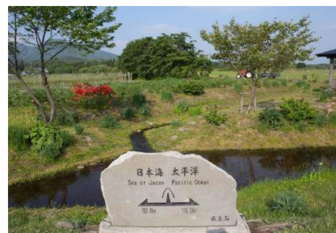
最上町 堺田分水嶺秋のコンサート