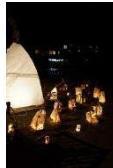
最上町 赤倉温泉 豆名月 栗名月