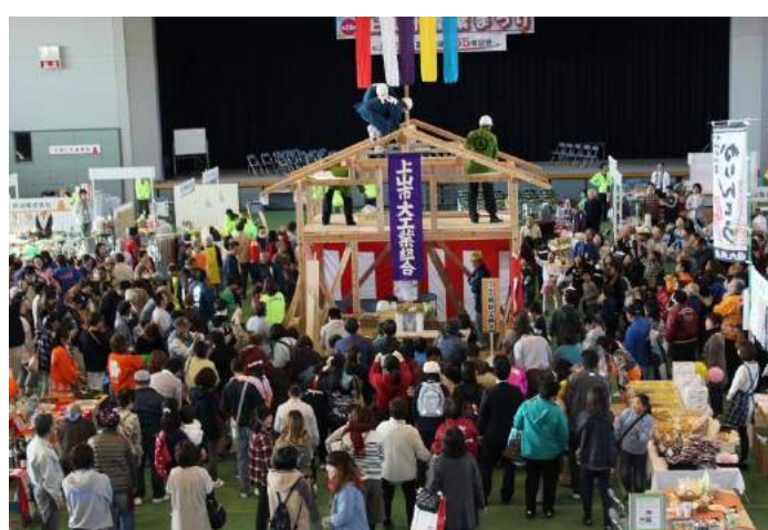
上山市 上山市産業まつり