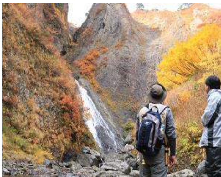
戸沢村 浄の滝トレッキング