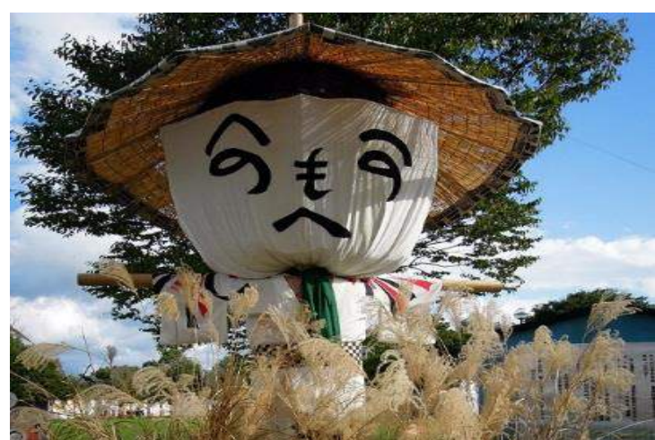
上山市 全国かかし祭り