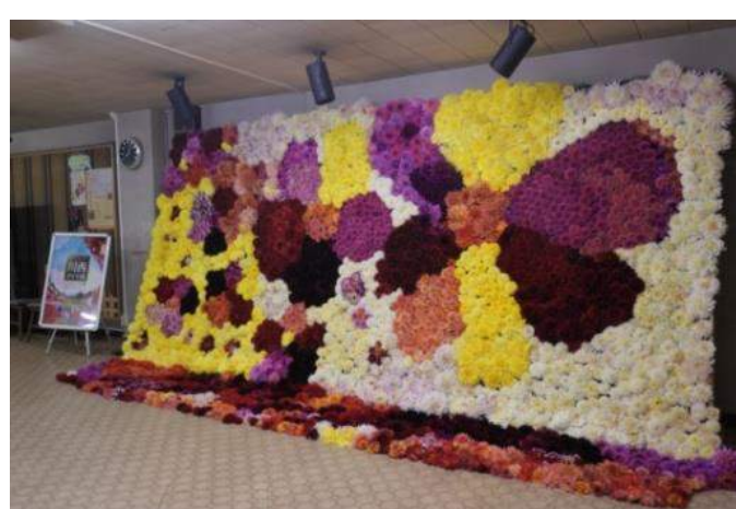
川西町 かわにし産業フェア