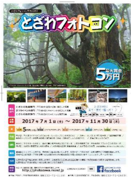
戸沢村 とざわ フォトコン