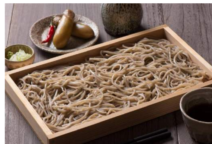
大石田町 新そばまつり