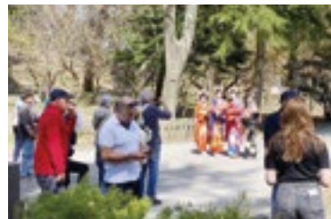
酒田市内を観光する乗客