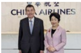
航空会社へトップセールス

年間を通じて温暖な台湾では、雪や桜、紅葉などを楽しめる山形県が旅行先として人気です。コロナ禍前には、県内空港へのチャーター便などを利用して本県に年間約23万人が訪れており、今後も来県が期待されています。