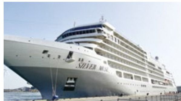
酒田港に寄港したシルバー・ミュージズ号

新型コロナの感染拡大以降、外航クルーズ船の日本への寄港が中断されている間も、国や県、市町村、民間団体が組織する「プロスパーポートさかた」ポートセールス協議会を中心に、外航クルーズ船の運航会社などに対する働きかけや受入態勢整備を行い、誘致につながりました。