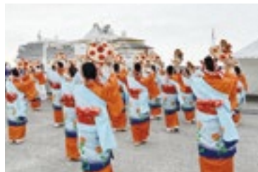
花笠踊りでお見送り

酒田港に降り立った乗客は、羽黒山や最上川舟下りなど、庄内地域を中心とした観光ツアーを楽しみました。また、シルバー・ミュージズの寄港の際は、船長など乗組員の皆さんに庄内の旬の食材を使った料理を試食してもらい、本県の食の魅力をPRしました。今後、クルーズ船内で本県の食材を使用してもらうための取組みも進めていきます。