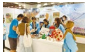
タイ旅行博山形県ブース

4月30日から5月2日まで、東北観光推進機構が主催するタイの旅行博に出展し、本県の魅力をPRしました。