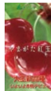
品川駅で放映したPR動画

品川駅自由通路の大型ビジョンや都営地下鉄の車内などでPR動画を放映するとともに、銀座三越でのPRイベントや銀座エリアの飲食店で「やまがた紅王」を使用したメニューの提供などを行いました。