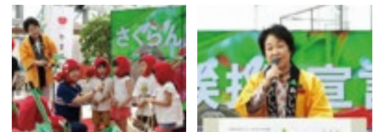
山形さくらんぼキックオフイベント

最上川ふるさと総合公園での「山形さくらんぼキックオフイベント」や「やまがた紅王デビュー記念イベント」をはじめ、各種メディアを活用し国内外でさまざまなプロモーションに取り組んでいます。