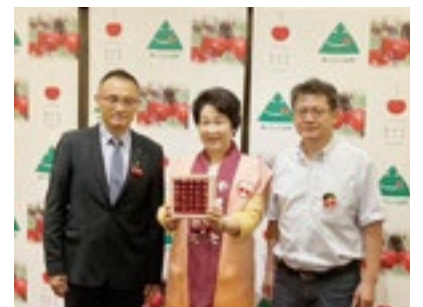
台湾でのプロモーション

吉村知事が5月30日に台北市内で「やまがた紅王」のプロモーションを行いました。真っ赤な大玉で甘い「やまがた紅王」は、台湾の方々にも大好評でした。果肉が硬く日持ちが良い「やまがた紅王」の特性を生かし、今後の輸出が期待されます。