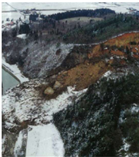
地すべり災害(じすべりさいがい)