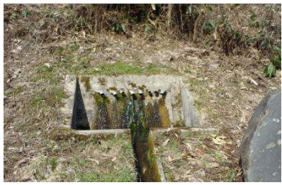
水路工（すいろこう）・横ボーリング