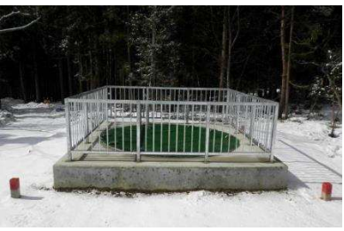
集水井（しゅうすいせい）