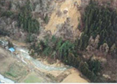
さいがい 地すべり災害はっせい