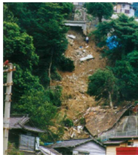
がけくずれ災害(さいがい)