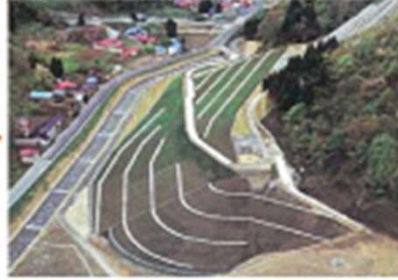
たいさく 地すべり対策かんせい

いろいろな工事でわたしたちのくらしが守られているんだね。 でも、避難指示 ひなんしじ が出されたり、土砂災害 どしゃさいがい がおきたらどうす ればいいのか？