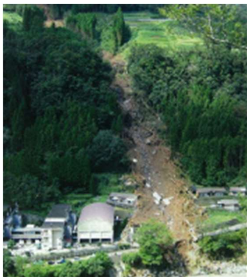
土石流災害(どせきりゅうさいがい)

そのひとつに土砂災害 どしゃさいがい があります。大雨や地しんなどで、山などにある急なしゃ面 しぜんさいがい がくずれて、土や岩が水といっしょになってわたしたちにおそいかかってくるのが「土砂災害 どしゃさいがい 」です。土砂災害は、いっしゅんのうちにわたしたちの大切な命やざいさんをうばう、おそろしい災害 さいがい です。