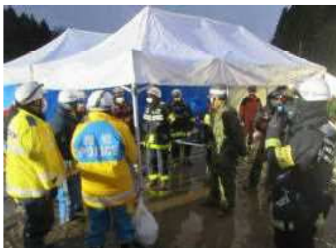
鶴岡市西目地区土砂災害現場 (令和4年12月31日発生)