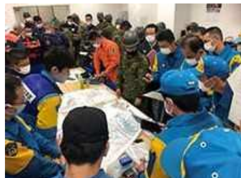
静岡県熱海市土石流災害現場 (令和3年7月3日発生)