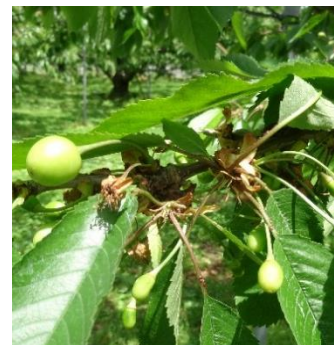
おうとうの結実不良