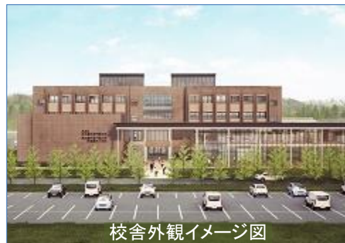
校舎外観イメージ図