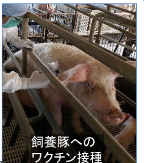
飼養豚へのワクチン接種