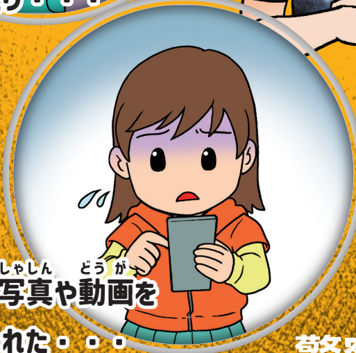
はずかしいしゃしん どうが 写真を おく 送れといわれた・・・