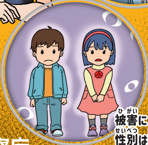
ひがい 被害に せいべつ かんけい 性別は関係ない・・・