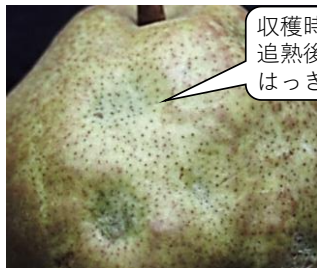
カメムシ類の被害果