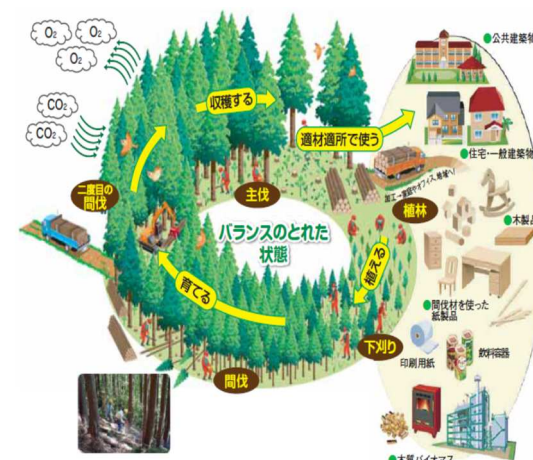
健全な森林のサイクル