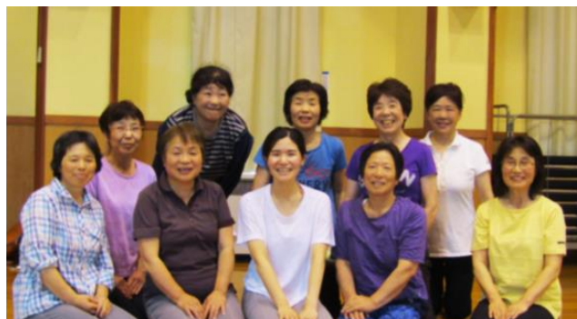
いきいき元気すっきり体操