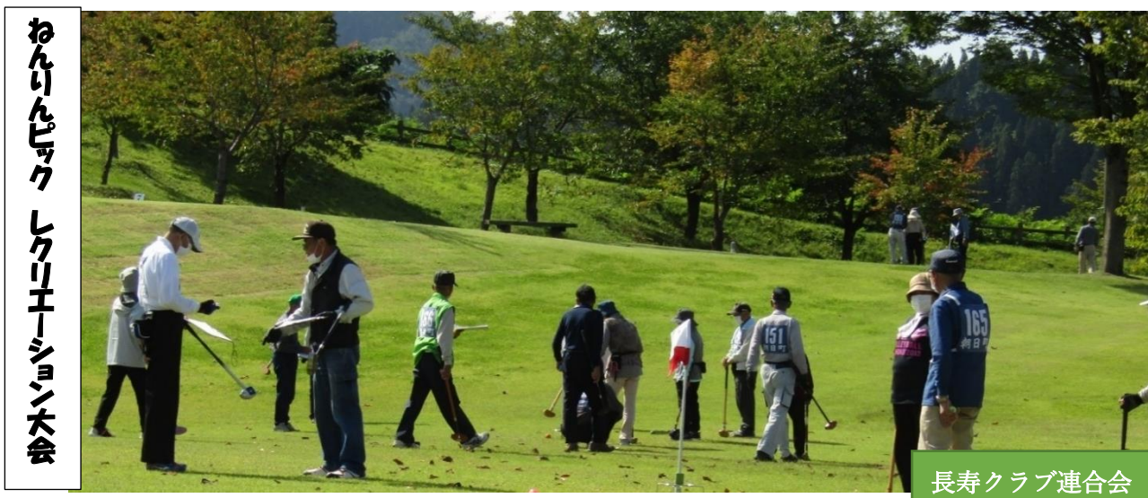
ねんりんピック レクリエーション大会