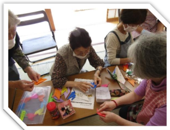
「輪になる鶴折」一緒に展示しましょう