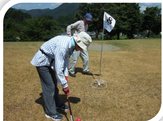
グラウンドゴルフは生きがい