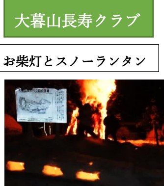
大暮山長寿クラブ