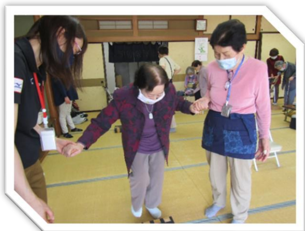
階段の昇り降り…支えているから大丈夫だよ♡