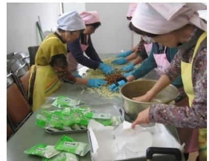
新1年生に贈る豆菓子作り