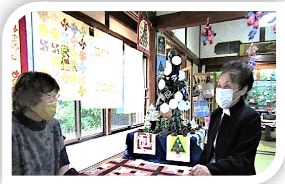
パッチワークも楽しいけれど皆とのおしゃべりが楽しい

また、文化やスポーツなどの趣味の活動や仕事、家族との交流は、楽しみや生きがいとなります。生活支援コーディネーターが、これまでに掘り起こしたものを紹介します。