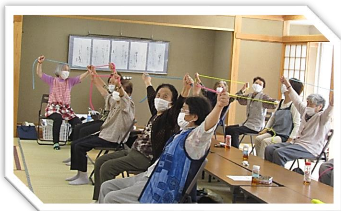
ゴムバンドでストレッチ!!「気持ちいい〜！」

仲間とのふれあいがとっても楽しいです。スタッフが心を砕いて、いろいろなレクリエーションや折り紙、絵手紙、工作などを準備してくれます。第2・第4火曜日は「骨々サロン」、柔道整復師の先生が指導してくれます。介護予防、仲間づくり、居場所づくり、認知症予防、情報交換、閉じこもり予防、生きがいつくり、健康づくりになっています。第3火曜日は「認知症カフェ」です。