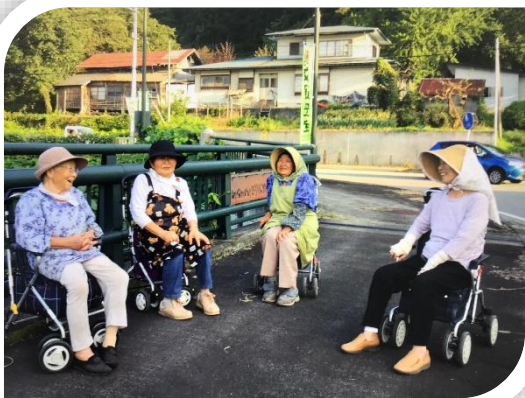
散歩は楽しい語らいの時