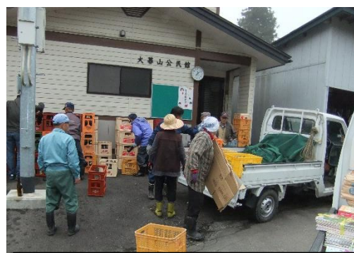
資源回収は長寿クラブの受け持ち