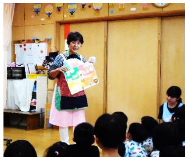
保育園での食育活動

食生活改善推進協議会は食に関する健康づくりボランティアです。「男の料理教室」をはじめ郷土料理の普及や食育活動、小学校の入学式の折、昔からの慣習で「豆のように丸く優しく育ててほしい」という願いを込めて豆菓子を贈っています。