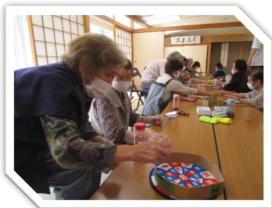
サイコロで勝負！燃えます！