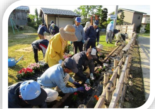
気心の知れた皆とのふれあいが楽しい花いっぱい運動