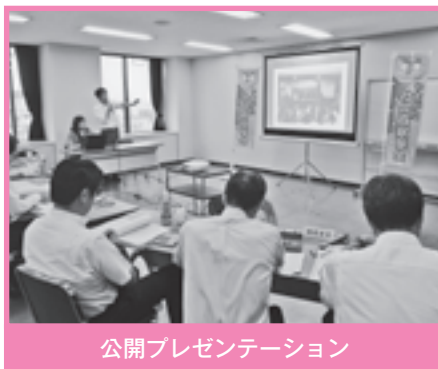
公開プレゼンテーション