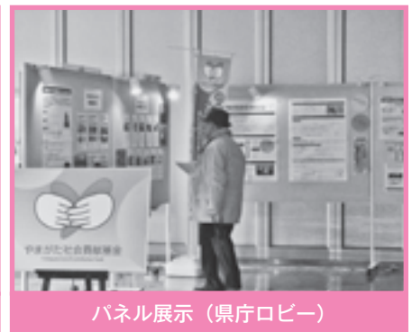
パネル展示（県庁ロビー）