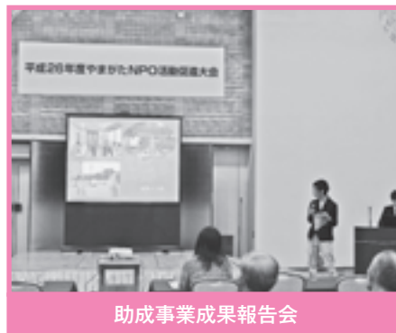
助成事業成果報告会