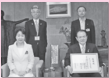
山形トヨペット(株) (H25.6.27)