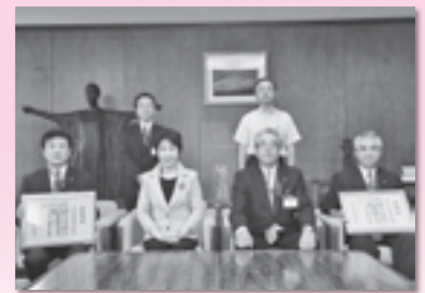
山形日産自動車(株) 日産プリンス山形販売(株) (H25.8.1)