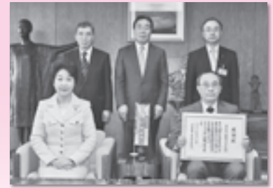
(株) 蔵王サプライズ (H25.4.24)