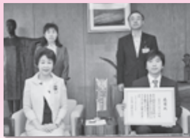
(株) メカニック (H25.7.4)