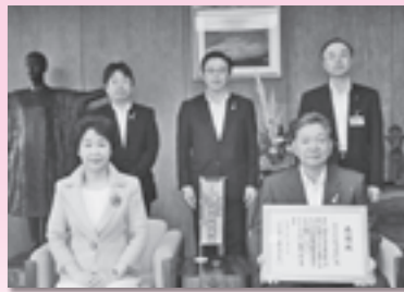
(株) 荘内銀行 (H25.8.6)