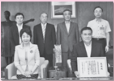
山形県民共済生活協同組合 (H25.8.5)