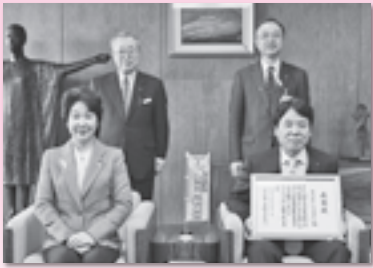
(株) シェルター (H25.4.10)