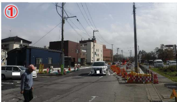
▲ 起点側 現況整備状況(R5.4.12)