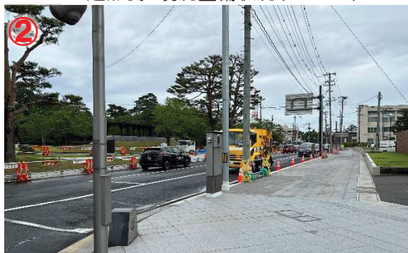
▲ 終点側 現況整備状況(R5.6.9)