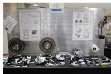
ブレーキユニット