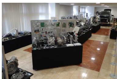
自動車部品ライブラリー

展示場所 山形県自動車部品ライブラリー『アクセル』（山形県高度技術研究開発センター内） 見学について 予約不要で、どなたでも見学いただけます。 来場の際、同センター内の山形県産業技術振興機構 研修課で受付をお願いします。 （受付時間 平日 9:00～12:00、13:00～16:00） ※団体見学の際は、事前に研修課へ電話にて日時、人数等をお知らせください。