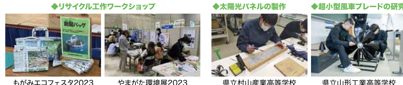
もがみエコフェスタ2023 やまがた環境展2023 県立村山産業高等学校 県立山形工業高等学校

カーボンニュートラルチャレンジ応援補助金 県内の高校生以上により構成される団体が実施する、カーボンニュートラルにつながる活動に対して支援しています。