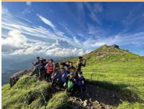
山形の「山」の魅力は世界一!

皆さんの暮らしの中には、どんな「幸せ」があるでしょうか。おいしいものを食べたとき、家族や友人と過ごす何気ないひととき、ふと感じる季節や景色の移ろい。豊かな自然と食に恵まれ、伝統や文化の息づく山形。