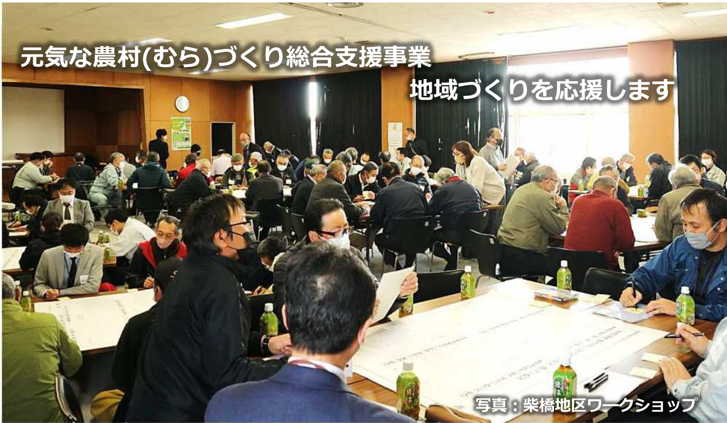
写真：柴橋地区ワークショップ