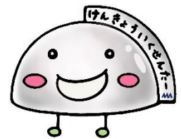
山形県教育センター 公式キャラクター「せんたん」

ウェブページのリニューアルに合わせて、資料をデータ化したよ。上の3つの扉は、研究世界への入口。きみは、どの扉から探訪してみたい？