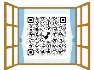
長期研修生による研究

県教育センターで調査研究をしているって知っているかい？山形のよさを活かした教育を推進するために、学校や研究機関などと連携を図りながら、時代の要請を受けた研究を進めているんだ。