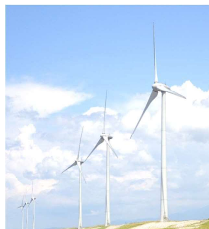
県営酒田風力発電所（酒田市十里塚）

○ 酒田市沖においては、「酒田沿岸域検討部会」を、令和4年9月から令和5年3月にかけて合計3回開催し、再エネ海域利用法に基づく協議会の設置に向け、国へ情報提供することの確認を行いました。