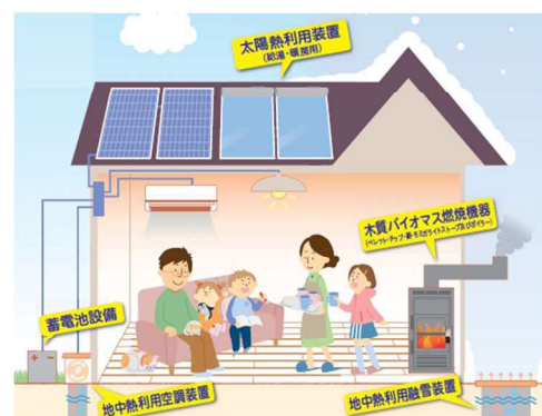
みら やまがた未来くるエネルギー補助金 対象設備