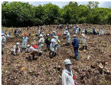
やまがた森の感謝祭 2022 （県全体として行われた森づくりイベント）