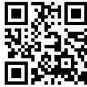
県山岳情報ポータルサイト ※「やまがた百名山」を全て掲載しています