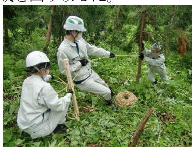
やまがた絆の森づくり （企業等が実施する継続的な森づくり活動による 環境貢献と地域交流による里山地域の活性化）

また、みどり豊かな森林環境づくりの推進においては、地域住民や市町村、企業などが行う森づくり活動への支援を行うとともに、森林生態系をはじめとする自然環境を保全するための各種調査を行い、自然環境を保全する対策を実施しました。併せて豊かなみどりを守り育む意識の醸成するため、「やまがた木育」などを通して森林・自然環境学習等を進めるとともに、森づくりイベントや広報誌を活用して、みどりを育む意識の醸成を図りました。