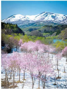
残雪と大山桜（月山） 令和4年度「やまがた百名山」 写真コンテスト 年間グランプリ