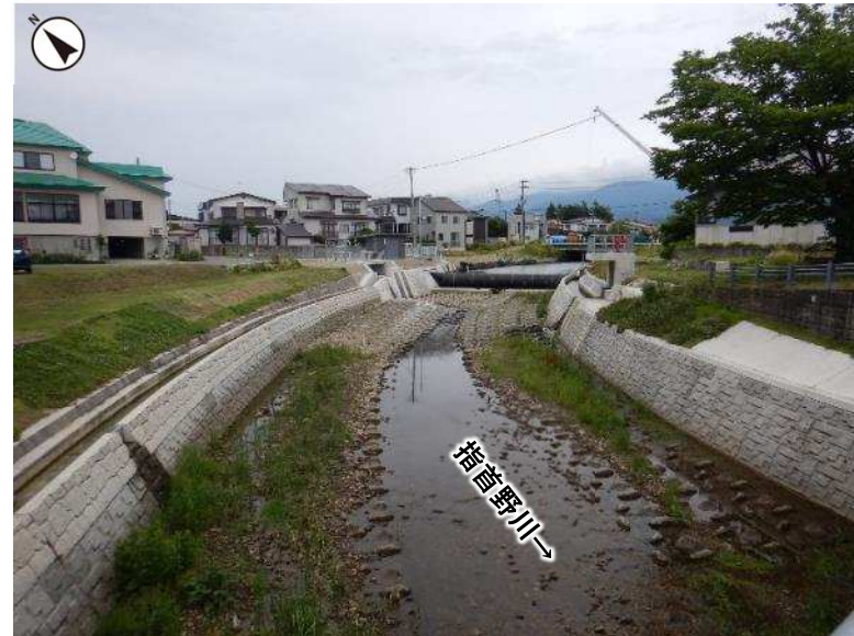
河川整備状況 (令和5年6月撮影)