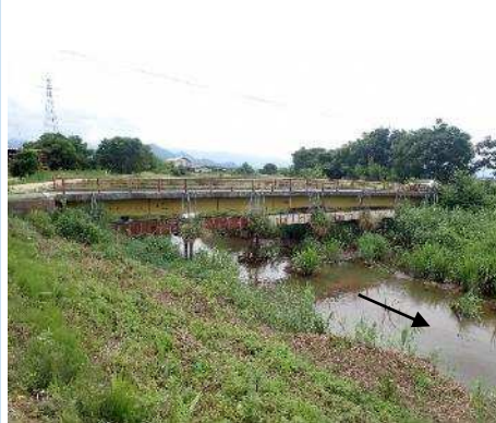
架替予定橋梁 (中瀬橋)