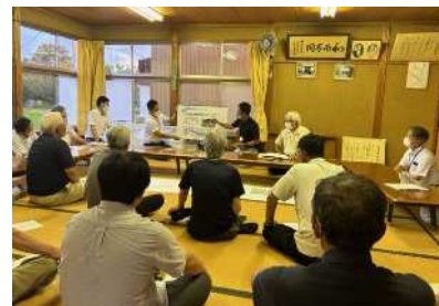
事業説明会 (令和5年7月)