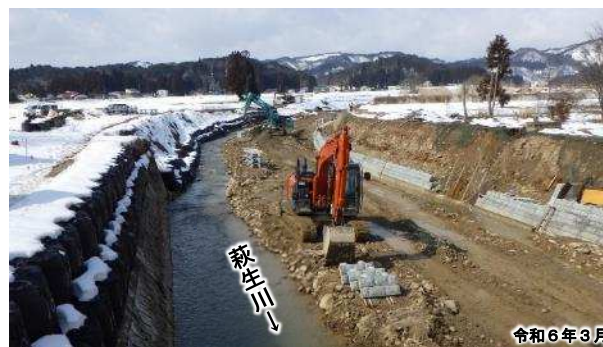
施行中区間の状況