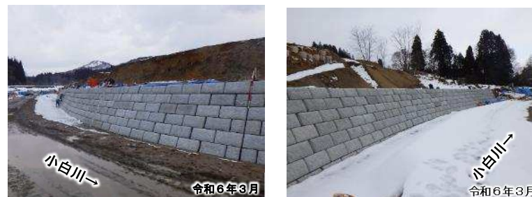
施行中区間の状況