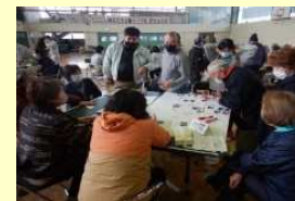
地域のお話合いによる 管理計画づくり