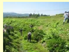
農業者のみの草刈り