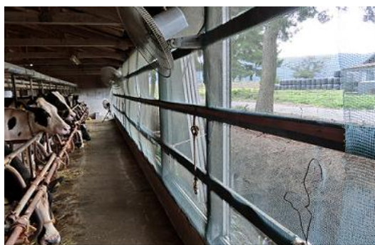
畜舎周辺への防虫ネット設置