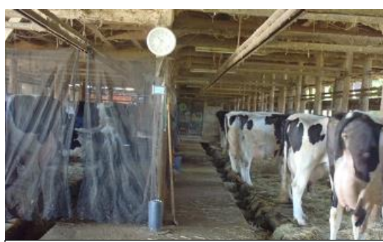
抗体陽性牛と陰性牛の分離飼育