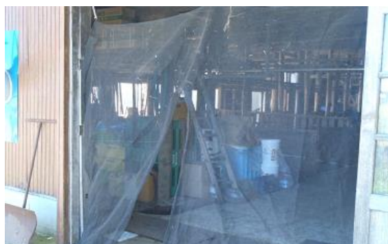
畜舎開口部への防虫ネット設置