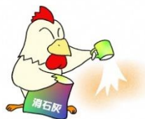
家きん舎周囲への 消石灰散布