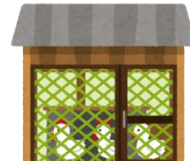
金網・ネット等の 点検および修繕