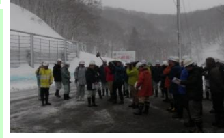
委員による現地視察(H28.2.15)

道路管理の検討にあたり、専門家や利用者の意見を聴くことを目的に、学識経験者、民間、国、警察、消防、沿線4市町からなる会議を実施しています。