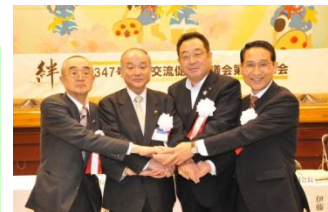
左から大石田、尾花沢、大崎、加美の各市町長 (H27.5.1)

沿線の宮城県大崎市、加美町、山形県尾花沢市、大石田町の2市2町が、鍋越峠の通年通行を契機に、県境を越えた交流により地域連携を深め、鍋越峠の携帯電話不感区間解消の要望活動などに取組んでいます。